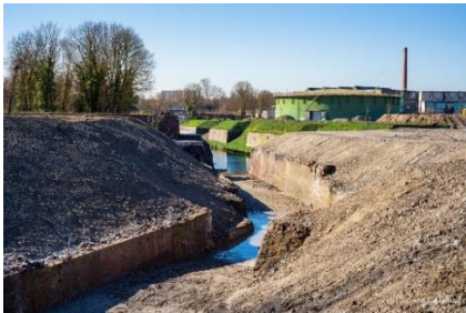
Groene Gashouder en vrijgraven vestingwerken

de bewoners goed bereikbaar is. Nu deze opgave is volbracht, is de gedachte om het park meer beleefbaar te maken. Samen met belangenorganisaties, onder andere Stichting Maastricht Vestingstad, wordt nagedacht over de wijze waarop cultuurhistorie en natuur beter voor het voetlicht kunnen worden gebracht.