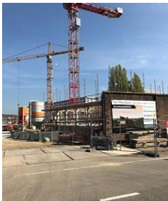
CPO in aanbouw

gekocht en zijn gestart met de bouw. De CPO Parkwoningen zal naar verwachting medio 2019 met de uitvoering starten om ongeveer tegelijk met de anderen klaar te zijn. Een uitdaging voor de CPO's is nog de gezamenlijke inrichting en het beheer van de gemeenschappelijke binnentuin. Zoals eerder aangekondigd zal er een gezamenlijke evaluatie plaats vinden om de leerpunten vast te leggen waarvan bij nieuwe CPO-initiatieven gebruik kan worden gemaakt. Deze evaluatie zal met uw raad worden gedeeld in de context van de beleidsevaluatie met betrekking tot particulier opdrachtgeverschap.