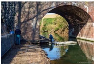
Aanleg wandelpad lage Fronten

In 2013 is gestart met de aanpak van de vestingmuren en de aanleg van een eerste wandelpad door het park. Van 2015 tot en met 2018 zijn de oude vestingmuren aan de Lage Fronten deels vrij gegraven en geconsolideerd in combinatie met natuurversterkende voorzieningen en zijn nog meer verbindingen (wandelpaden met vlonders over het water, trappartijen en fietspaden) aangelegd. Uiteraard heeft de toegankelijkheid voor mindervaliden hierbij onze aandacht. Er zijn goede verbindingen gemaakt vanuit het stadscentrum naar het Frontenpark. In het Frontenpark zijn de fietsroutes en is de nieuwe wandelroute bovenop de Lage Fronten zodanig uitgevoerd dat deze voor eenieder toegankelijk zijn. Vanaf deze routes is het Frontenpark als geheel goed te beleven. Aan de kant van Boschpoort is nu nog bij het wandelpad een tijdelijke entree gemaakt in het talud langs het spoor. Deze tijdelijke entree wordt geschikt gemaakt voor mindervaliden in het kader van het tramdossier. Er is ook een nieuwe wandelroute gemaakt vanaf het Bassin beneden langs het water door de Lage Fronten en via de onderdoorgang Cabergerweg naar de Hoge Fronten. Deze wandelroute eindigt in de Hoge Fronten bij een (nog te realiseren) trap. Deze meer avontuurlijke wandelroute is uitgevoerd als zogenaamd 'struinpad'. Een prachtige circa 2 kilometer lange 'struinroute' door de natuur met beleving van de oude vestingwerken.