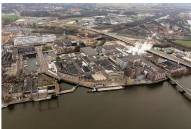
Luchtfoto Sappi – Landbouwbelang

In de voorliggende grex hebben wij de locatie Landbouwbelang derhalve niet meer budgettair neutraal afgesloten maar met een tekort van € 675.000,=. Dit tekort is meegenomen in de orendabele top van de grex. De boekwaarde blijft daarmee staan op € 6,5 mio.