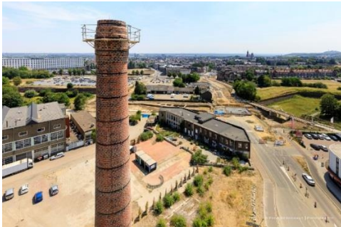
Schoorsteen en binnenterrein Radium

De schoorsteen is een herkenbaar 'landmark', de naamgever en baken voor het gebied. In 2018 is de schoorsteen gerestaureerd, een specialistisch en in het oog springend werk. De schoorsteen verkeert nu weer in een goede onderhoudsstaat. In 2018 stonden enkele (buiten)activiteiten op het programma rondom de schoorsteen. In 2019 wordt hier vervolg aan gegeven, waar mogelijk in samenwerking met aanwezige organisaties/huurders.